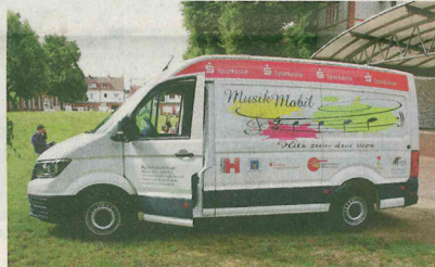
Das Musikmobil des Landkreises Hildesheim.

Bei der Feedback-Runde zum Schluss gibt es viele Komplimente. „Heute müssen sie noch entscheiden, was eingetribt wird“, erzählt Martensens. Denn am Ende des dreitägigen Workshops sollen ein bis zwei Lieder eingetribt und komplett gespielt werden. In den vergangenen Jahren passierte das vor Publikum. „In diesem Jahr fällt die Vorstellung am Ende coronabedingt leider aus“, so Martensens.